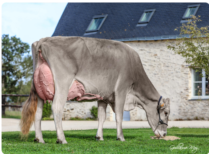
LBB LALICE ^

Pai: O MALLEY (BENDER) Mãe: LBB LALICE A. mat: VIGOR (PRESIDENT) A. mat: LBB GENIAL B. mat: JULENG B. mat: BRUNETTE