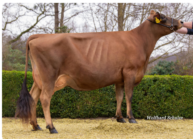
JOLA GP 84 ^