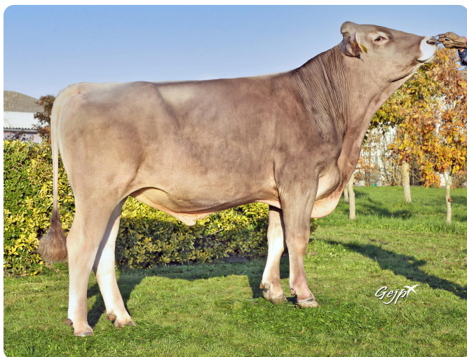
^ LBB RALICE

Pai: O MALLEY (BENDER) Mãe: LBB LALICE A. mat: VIGOR (PRESIDENT) A. mat: LBB GENIAL B. mat: JULENG B. mat: BRUNETTE