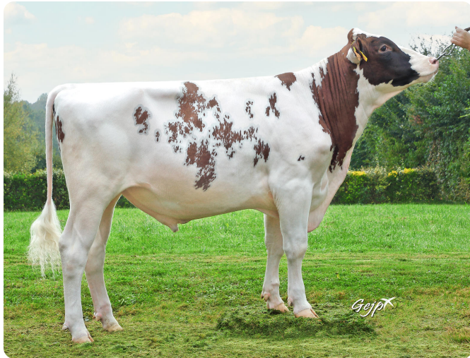
^ UHELGOAT P