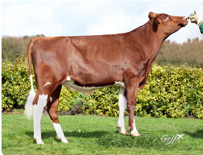
^ PLEYBEN P

Pai: ANRELI (RIVERBOY) Mãe: NEWDEHLI A. mat: UP P RED (PERF AIKO) A. mat: JELLINI B. mat: LACOSTE G B. mat: BELLINI