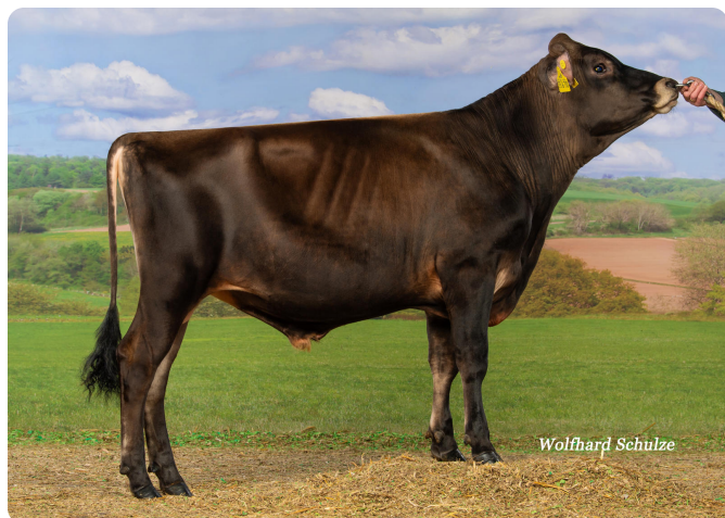
^ SHAKIRI P